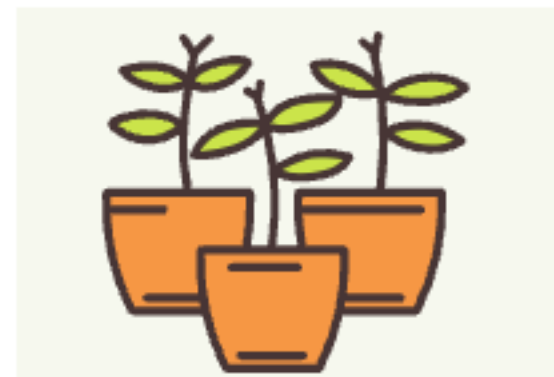
발아할 때까지 흙이 건조하지 않게 관리해주세요.