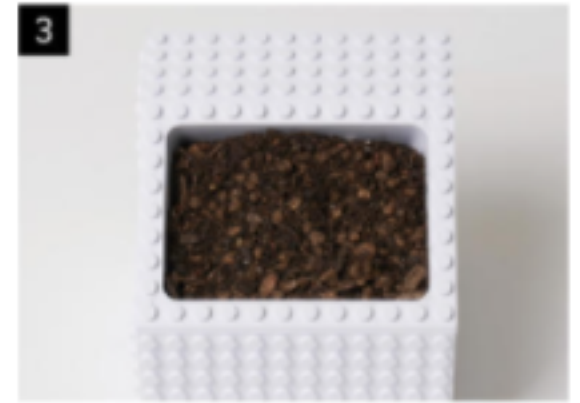
3 2번 봉투의 흙(배양토) 반 정도 덮고, 씨앗을 뿌려주세요. ※ 씨앗은 검은 봉투에 들어있습니다.