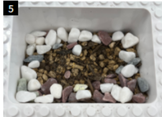
5 3번 꾸밈돌로 자유롭게 꾸며주세요 ※ 씨앗이 발아할 수 있는 공간을 비워주세요.