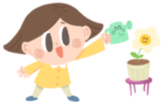
처음 씨앗을 심고, 흙이 꼭 젖을 정도로 물을 주세요.