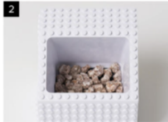
2 1번 봉투의 흙(마사토)을 모두 부어줍니다.