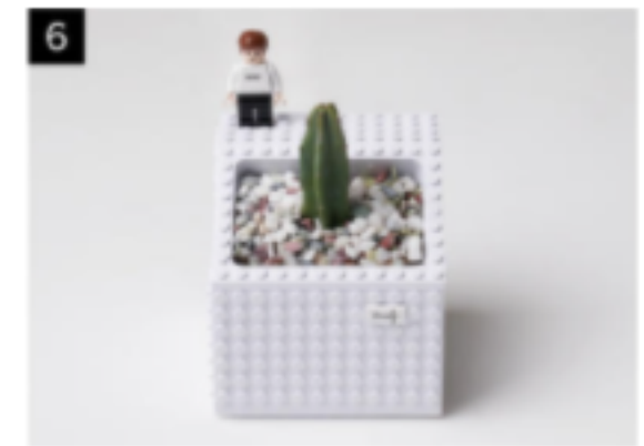
6 인스타피규어와 핸드블록으로 화분을 꾸며주세요.